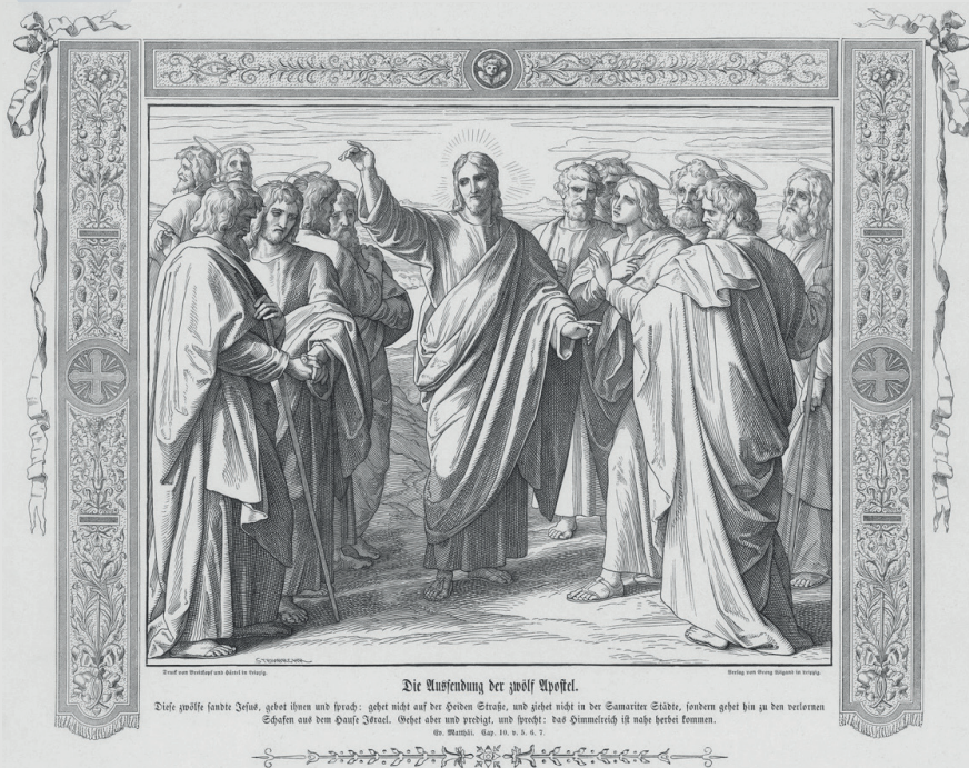
Bild: Julius Veit Hans Schnorr von Carolsfeld (1794 - 1872): Die Aussendung der 12 Apostel